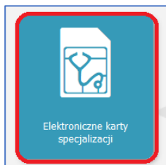
Rysunek 1 Kafelek Elektroniczne karty specjalizacji

Po zalogowaniu w odpowiedniej roli należy wybrać kafelek „Elektroniczne karty specjalizacji”.