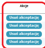
Rysunek 3 Lista zrealizowanych dyżurów medycznych po akceptacji dyżurów przez kierownika specjalizacji/kierownika stażu

Po użyciu przycisku „ Zapisz ” system zaprezentuje komunikat informujący o poprawności zapisu danych. Komunikat należy potwierdzić przyciskiem „ Dalej ”.