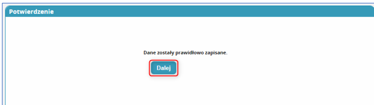
Rysunek 4 Potwierdzenie zapisania danych o usunięciu akceptacji dyżurów medycznych

Po użyciu przycisku „ Zapisz ” system zaprezentuje komunikat informujący o poprawności zapisu danych. Komunikat należy potwierdzić przyciskiem „ Dalej ”.